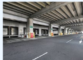
車路及び着車パース