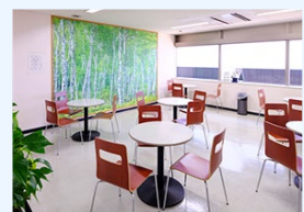
リフレッシュコーナー(3F)